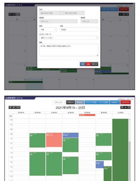
【管理システムイメージ画面】